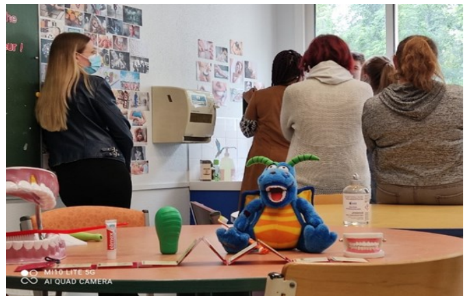
Formation Hygiène à l'EPMS de l'Ourcq, Claye-

En nous coordonnant avec l'ensemble des acteurs territoriaux impliqués dans la prévention et les soins dentaires, nous construisons ensemble une région plus inclusive en matière de santé orale.